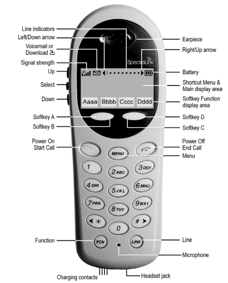
NetLink h340 Wireless Telephone

© 2007 SpectraLink Corporation P/N 72-1004-00 Rev. E Model # SNP2400, RNP2400 SpectraLink Corporation 800 755 5330 Boulder, CO 80301 info@spectralink.com